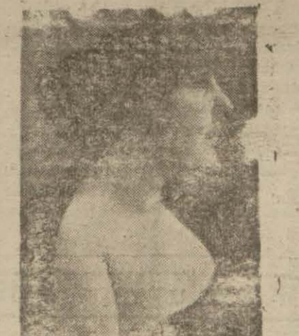
Prenses Şivekâr (Yazısı 6 inci sayfada)

Prenses Şivekâr, Kahirede mahkemeye müracaat etti